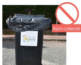
SAC PRÉSENT SUR LA COLLERETTE