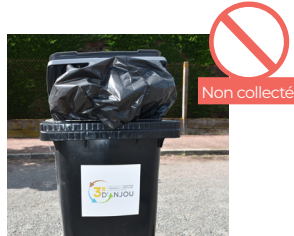
SAC DÉBORDANT (LE COUVERCLE DOIT ÊTRE FERMÉ)