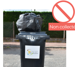
SAC OU TOUT AUTRE OBJET POSÉ SUR LE COUVERCLE DU BAC