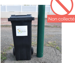
BAC TROP PROCHE D'UN OBSTACLE (POTEAU, ARBRE, VÉHICULE, ETC.)