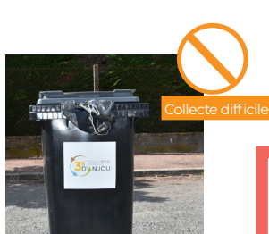
LANIÈRE OU SAC QUI DÉPASSE DU BAC