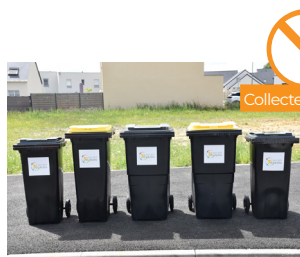
BACS JAUNES ET GRIS INTERCALÉS