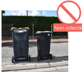
BACS POSITIONNÉS À L'ENVERS