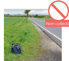
SAC POSÉ SUR LE BORD DE LA ROUTE OU À CÔTÉ DU BAC