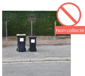
BACS TROP LOIN DE LA ROUTE