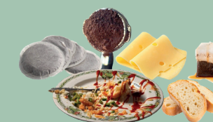
Restes de repas