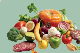
Fruits et légumes

Tous les déchets alimentaires solides de préparation et de reste de repas sont à déposer dans votre bac !