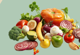
Fruits et légumes

Tous les déchets alimentaires solides de préparation et de reste de repas sont à déposer dans votre bac !