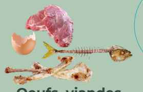
Oeufs, viandes et poissons

Pour le succès de l'opération, le respect des consignes de tri est impératif. Les biodéchets compostés iront enrichir des terres agricoles. La présence d'indésirables dans les biodéchets pourrait remettre en question le service.