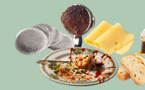
Restes de repas