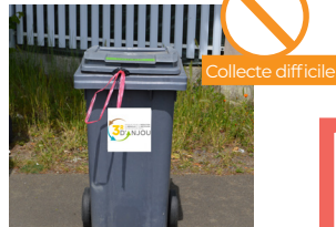
LANIÈRE OU SAC QUI DÉPASSE DU BAC