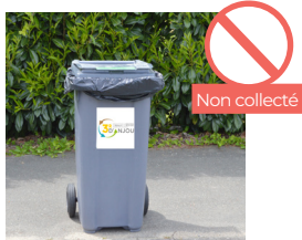
SAC PRÉSENT SUR LA COLLÈRETTE