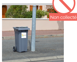
BAC TROP PROCHE D'UN OBSTACLE (POTEAU, ARBRE, VÉHICULE, ETC.)