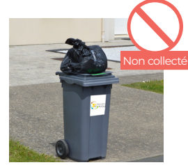
SAC OU TOUT AUTRE OBJET POSÉ SUR LE COUVERCLE DU BAC