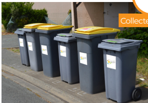
BACS JAUNES ET GRIS INTERCALÉS