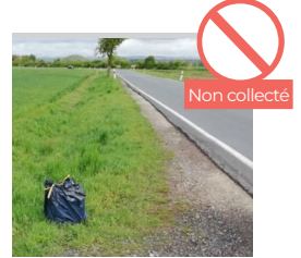
SAC POSÉ SUR LE BORD DE LA ROUTE OU À CÔTÉ DU BAC