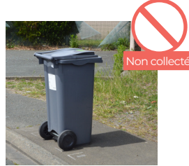
BAC POSITIONNÉ À L'ENVERS