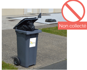
SAC DÉBORDANT (LE COUVERCLE DOIT ÊTRE FERMÉ)