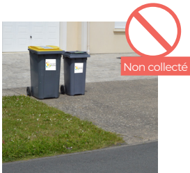
BACS TROP LOIN DE LA ROUTE